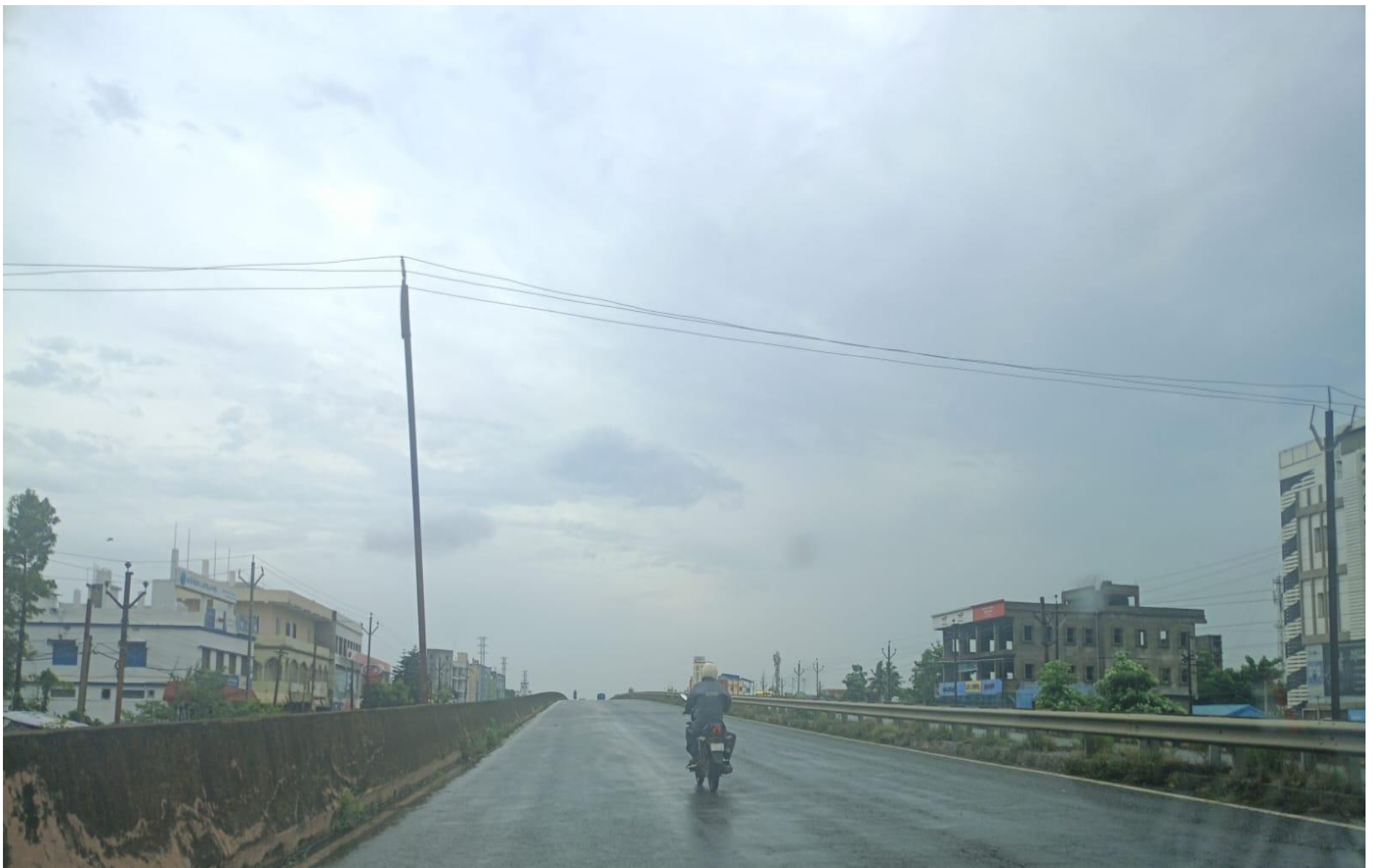
IMAGE: STRAIGHT ; Risk Level: Medium ; Coordinates: 21.511436, 86.892188