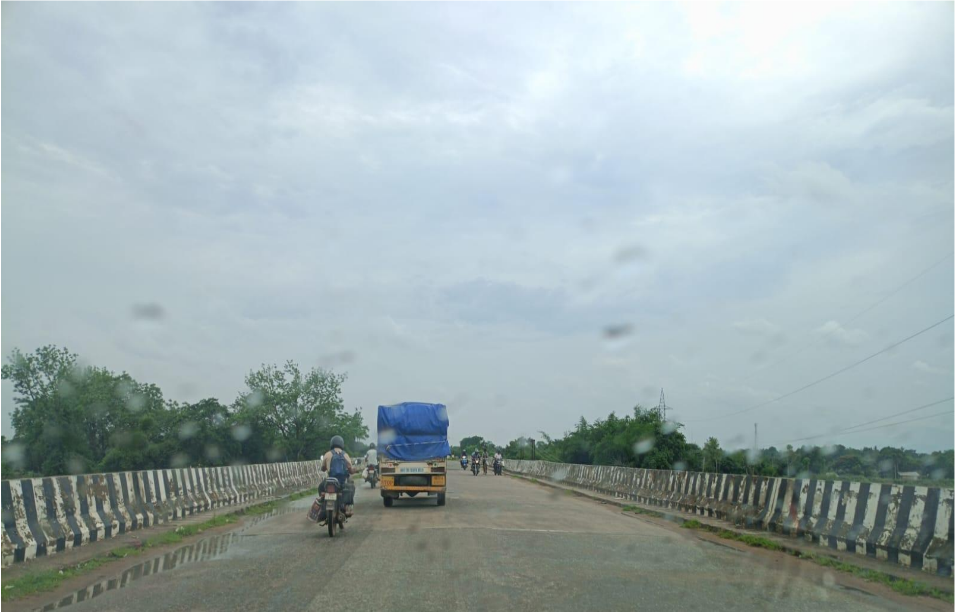
IMAGE: STRAIGHT ; Risk Level: Medium ; Coordinates: 21.544707, 86.933996