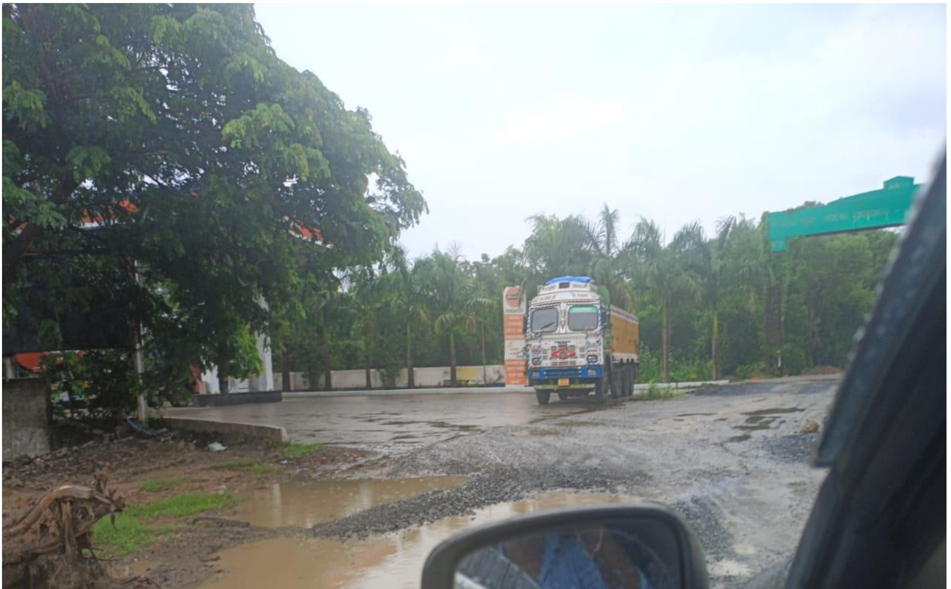
IMAGE: RIGHT TURN ; Risk Level: High ; Coordinates: 21.491857, 86.858955