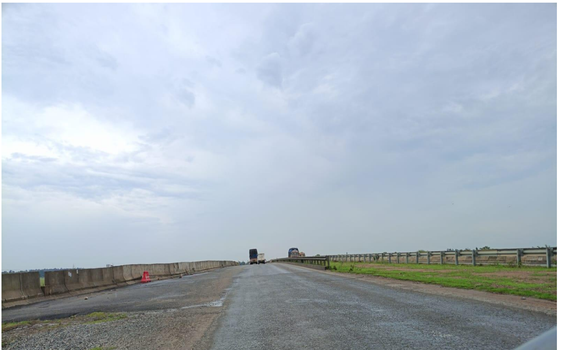
IMAGE: STRAIGHT ; Risk Level: High ; Coordinates: 21.538488, 86.90128