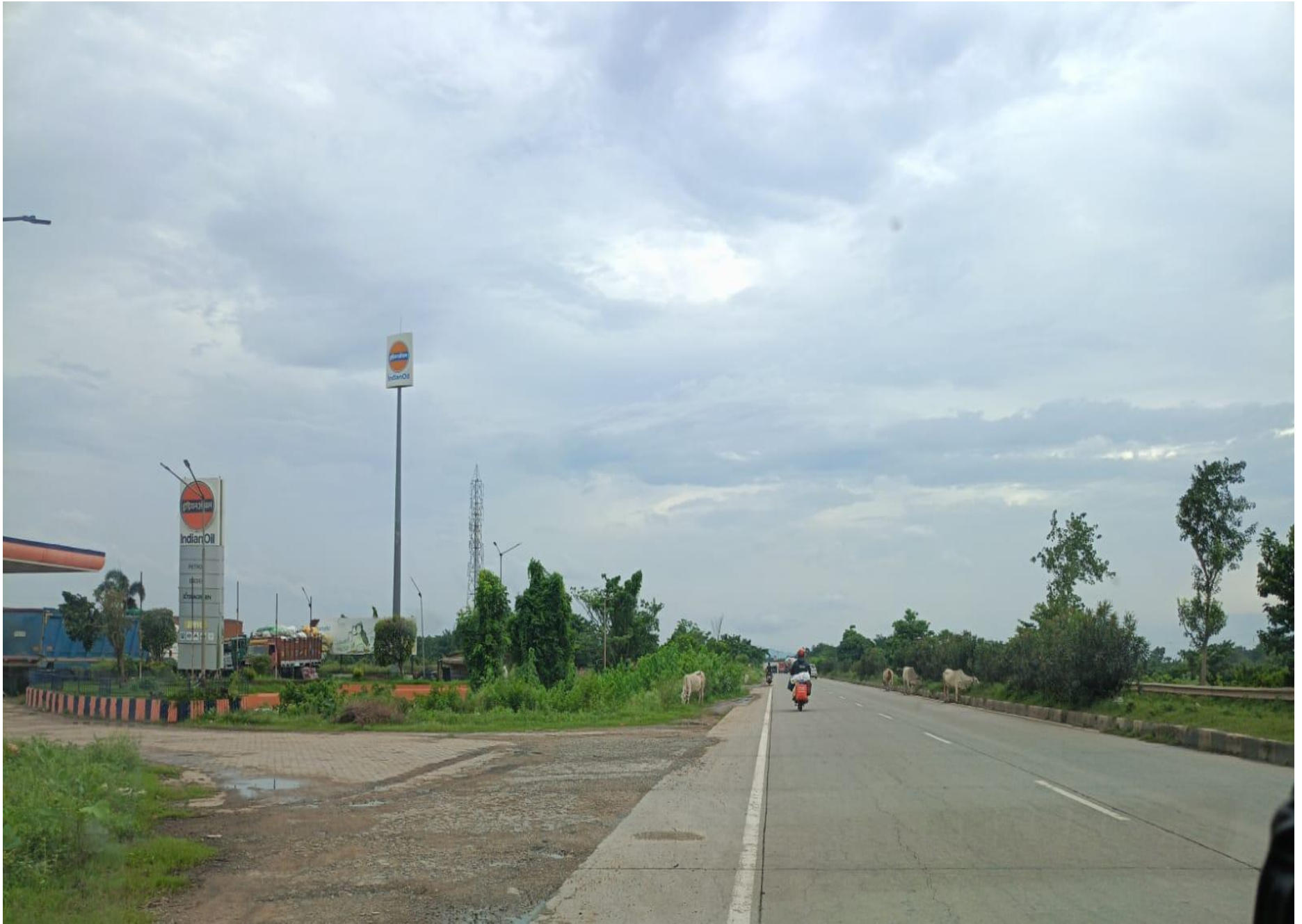
IMAGE: SHARP TURN LEFT ; Risk Level: High ; Coordinates: 21.5502612, 86.9448653