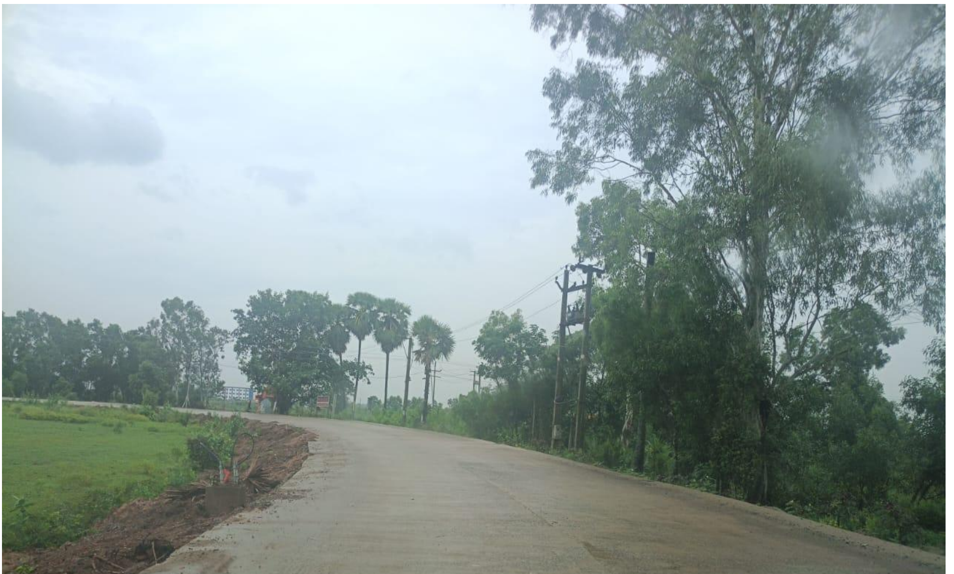
IMAGE: SHARP TURN LEFT ; Risk Level: High ; Coordinates: 21.489892, 86.861618