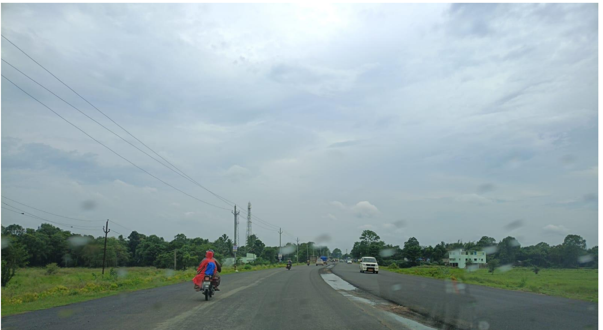
IMAGE: STRAIGHT ; Risk Level: MEDIUM ; Coordinates: 21.5385, 86.930403