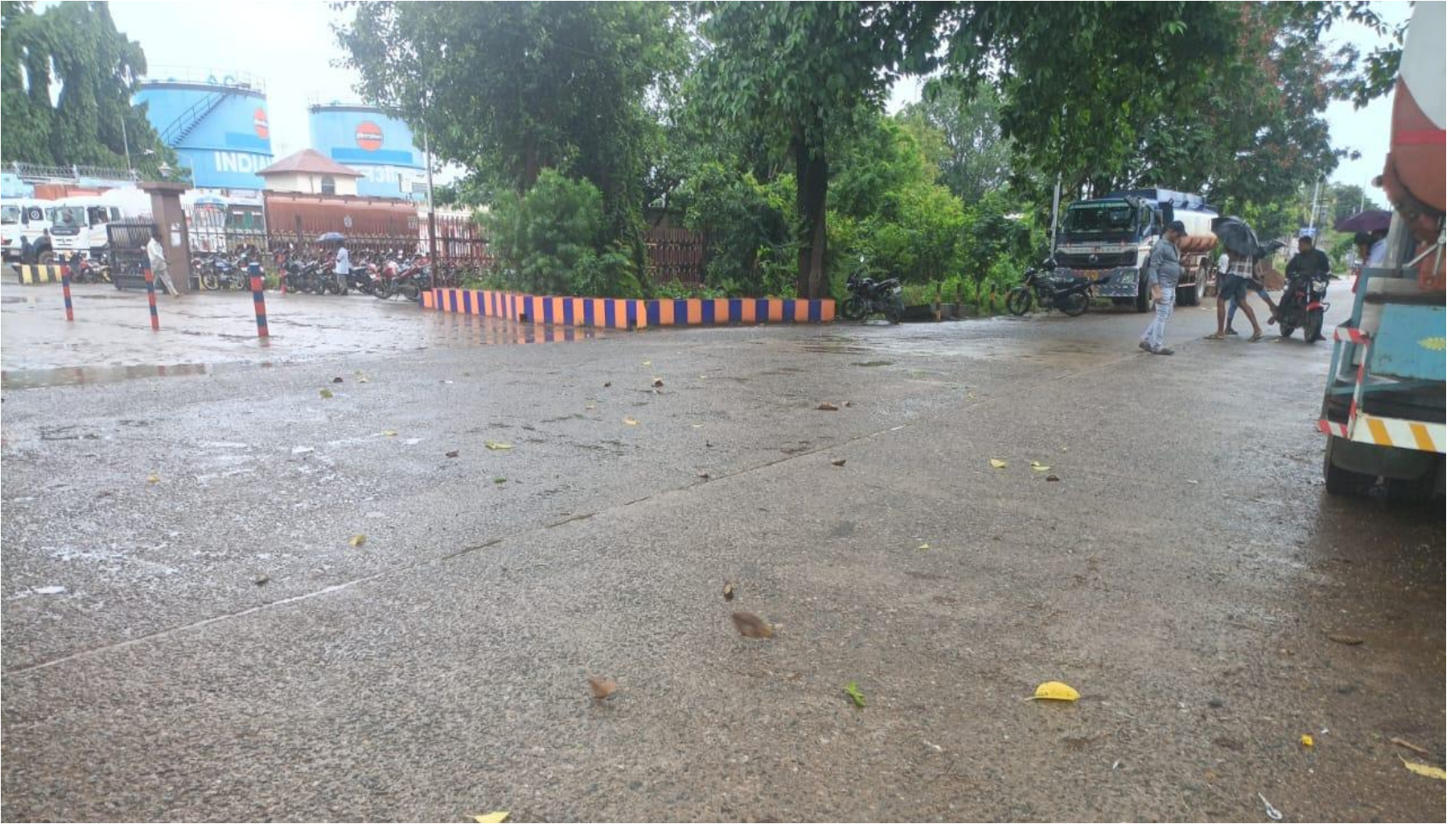
IMAGE: SHARP TURN LEFT ; Risk Level: High ; Coordinates: 21.494395, 86.848456