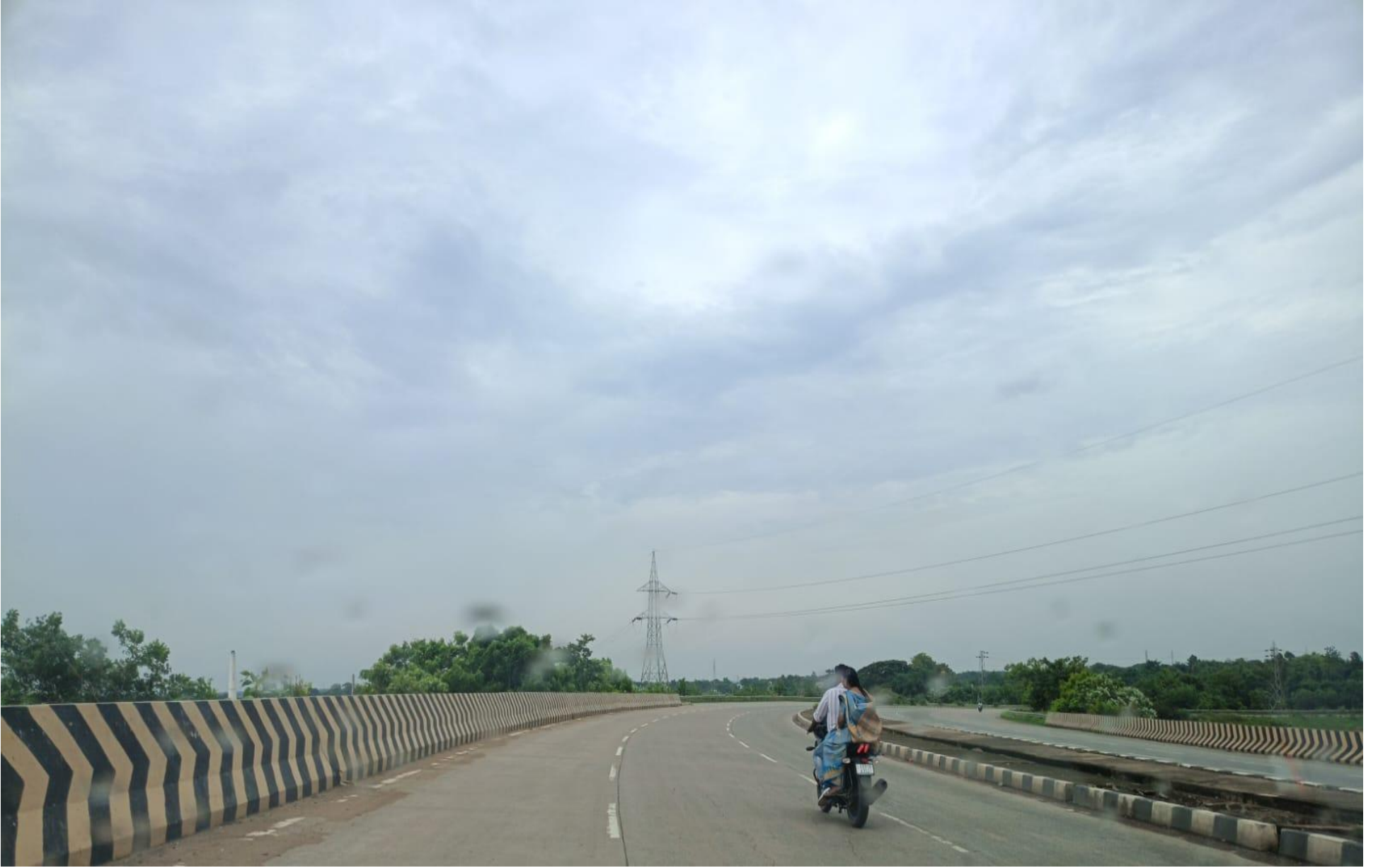
IMAGE: TURN RIGHT ; Risk Level: Medium ; Coordinates: 21.551086, 86.924864