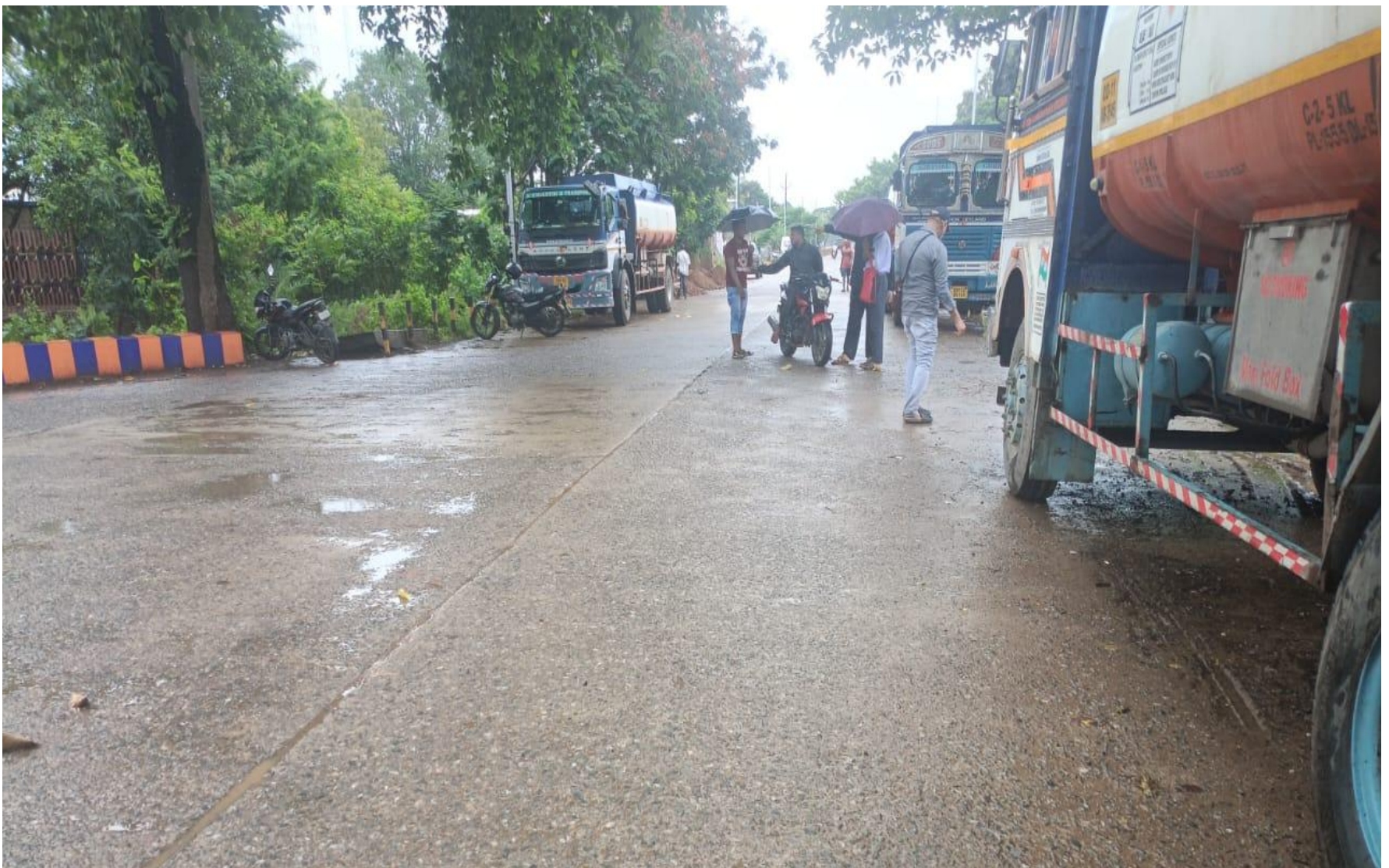
IMAGE: STRAIGHT ; Risk Level: MEDIUM ; Coordinates: 21.494401, 86.848468