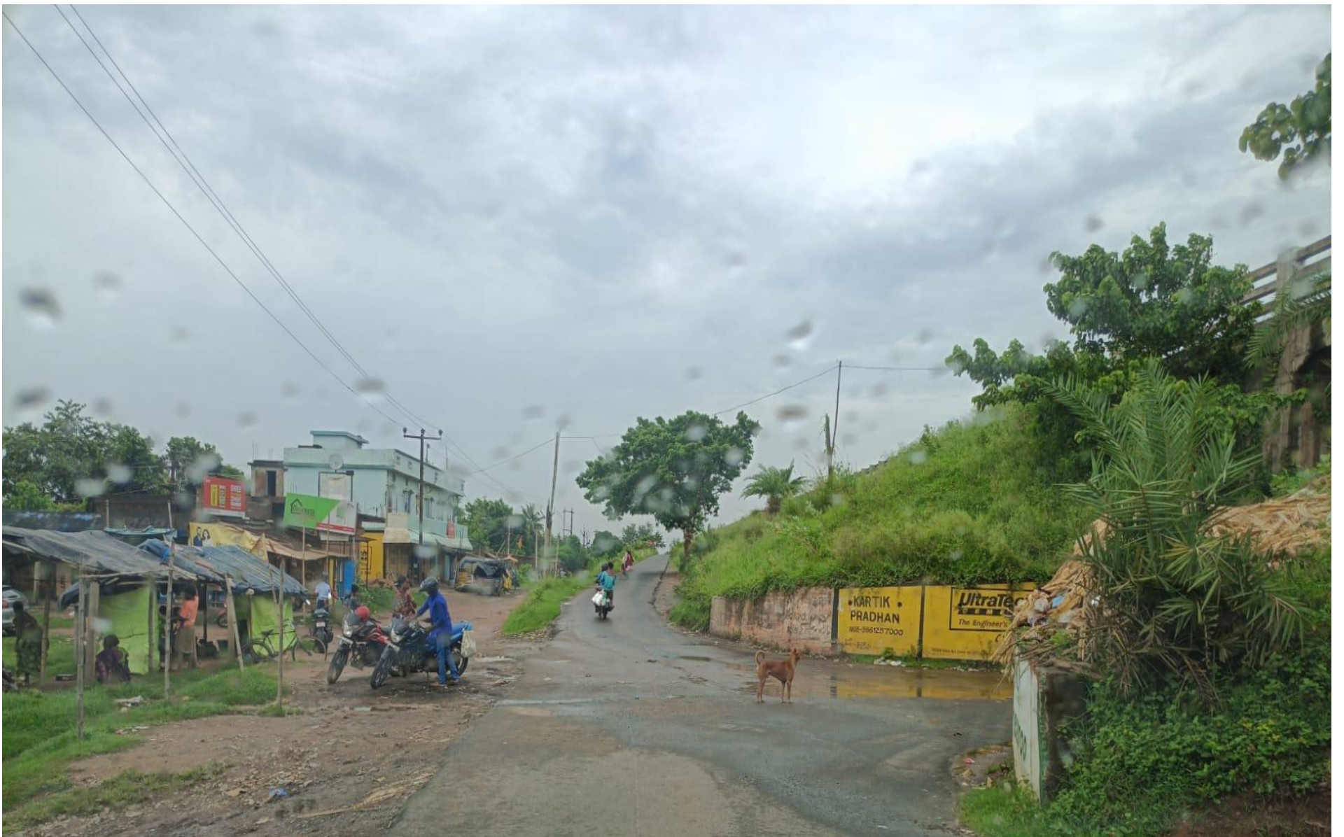
IMAGE: SHARP TURN RIGHT ; Risk Level: High ; Coordinates: 21.5494, 86.936415